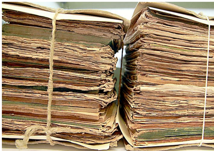
Zwei Stapel mit Urkunden: Verschwinden Aktenberge bald aus den Archiven?

Auch wenn die digitalen Akten auf dem Vormarsch sind, werden den Archiven immer noch neue Papierakten übermitteln, machte Becker deutlich. Der Trend zur Digitalisierung sei jedoch nicht mehr umkehrbar, meinte die Leiterin der Archivschule.